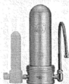
■ナチュリターンVIP 本体・カートリッジ

ナチュリターンは大自然の原理・摂理に基づいてエネルギーあふれる生きた水「自然回帰水」を生み出します。安全で美味しく、身体に沁みこむような水は、1日に3L飲んでもらうことで、新陳代謝を促進し健康を増進すると言われています。(3L水飲み健康法)。私たちは、自然回帰水の豊かなエネルギーを使って、使用後の水が河川や海を自然回帰させることを願い「10軒に1軒」ナチュリターンの普及による環境問題解決への提案も行っております。タイセイは、1985年に家庭用自然回帰生水器ナチュリターンを商品化して以来、96年に実用新案取得、日本発明特許学会発明賞受賞、さらに2006年には、ナチュリターンVIPが国際アンチエイジング大賞、ベストプロダクト賞を受賞するなど数々の高い評価を得ています。