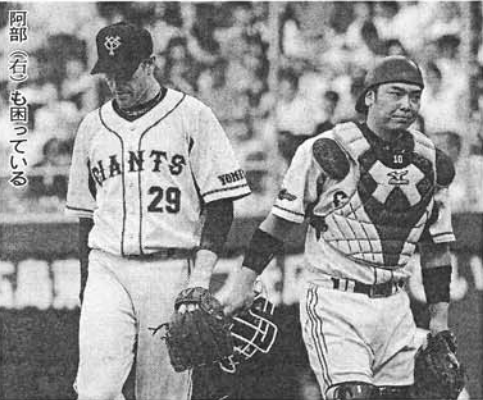
阿部(右)も困っている